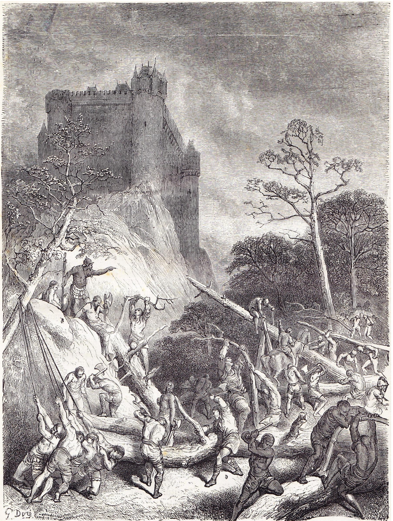
LA FÉODALITÉ. — Serfs travaillant pour le seigneur.